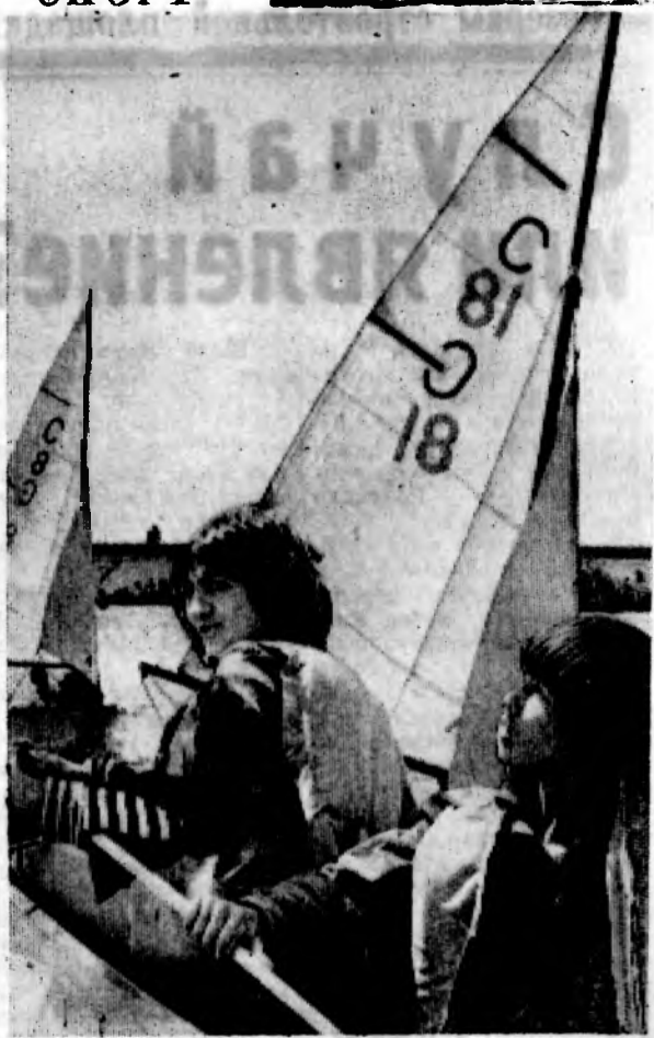
Большой популярностью у волгодонцев пользуются занятия водным спортом. На снимке: идет тренировка.